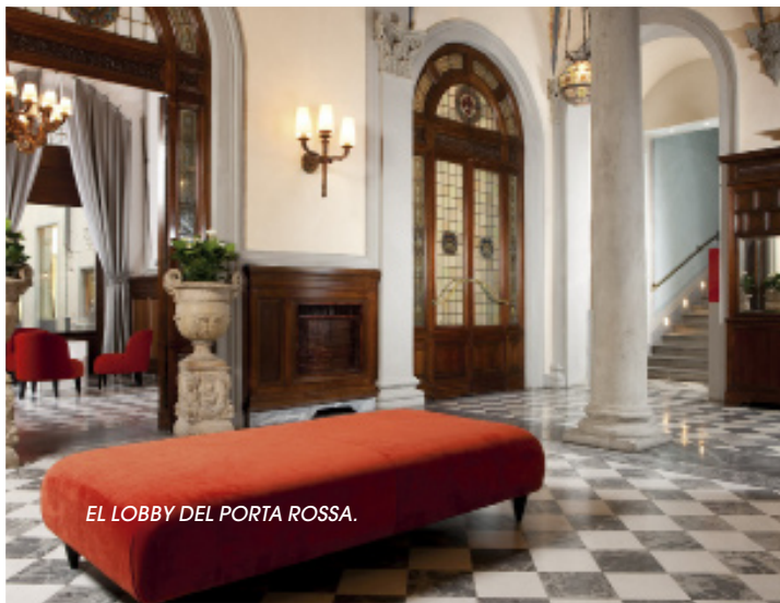
EL LOBBY DEL PORTA ROSSA.

De compras: Regalos gastro en Ino. www.ino-firenze.com .