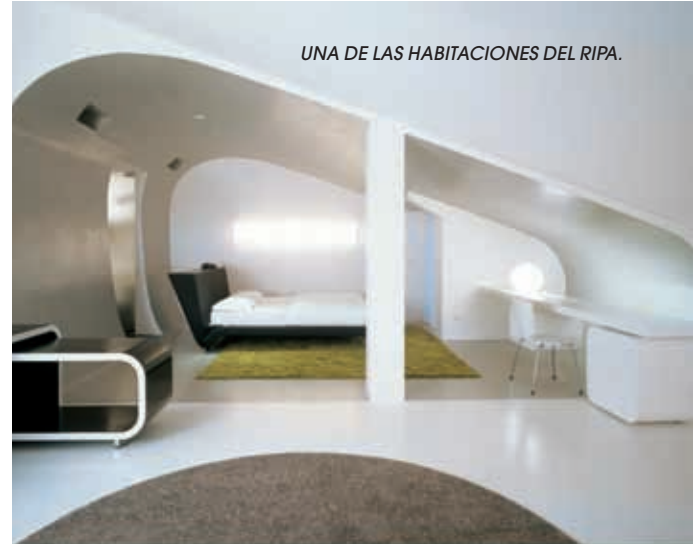
UNA DE LAS HABITACIONES DEL RIPÀ.

Un poco de cultura: La Embajada de Francia abre al público el Palazzo Farnese para ver su increíble colección de arte. www.ambafrance-it.org