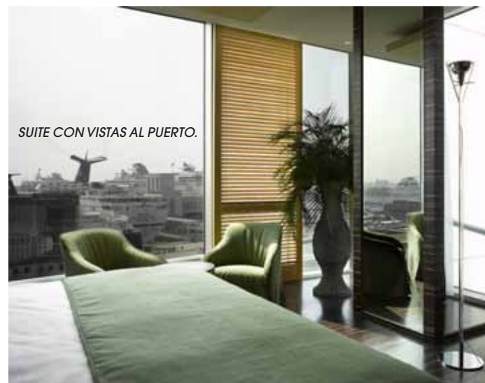
SUITE CON VISTAS AL PUERTO.

De cine: Las pizzas tradicionales que adoraba Julia Roberts en «Come, reza, ama». www.damichela.net . El café: Siempre en Gambrinus. www.caffegambrinus.it . Copas: En el bar clandestino Clandalú, al que accedes desde el jardín de la Piazza dei Martiri.